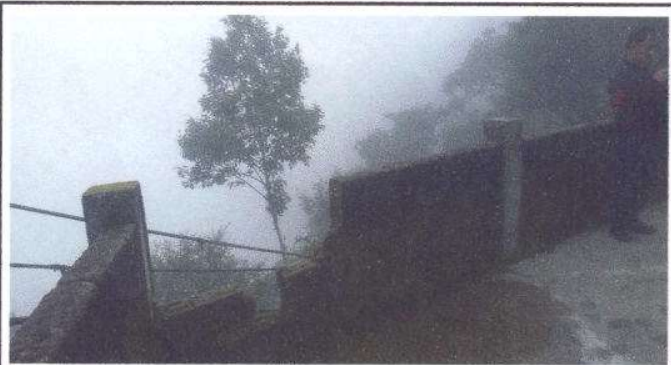
Foto 9: Reparación de muro perimetral de block, un total de 47.5 M2