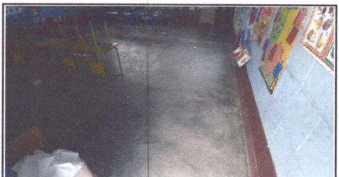
Foto 6: Sustitución de piso de cemento por piso cerámico, un total de 95 M2.

Observación: Si es necesario se pueden agregar hojas adicionales para actualizar el número de hojas.