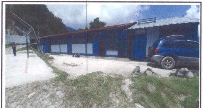
Foto 10: Sustitución de piso de tierra por torta de cemento, un total de 60 M2.