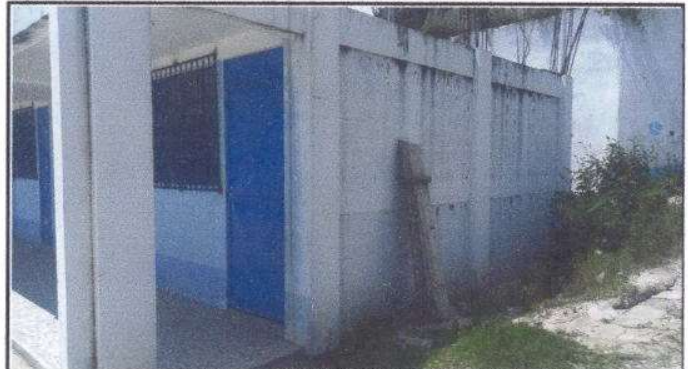
Foto 8: Pintura en muros interiores y exteriores, un total de 500 M2