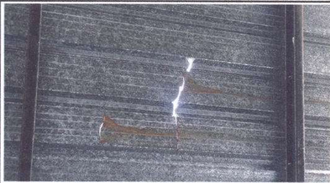
Foto1: Sustitución de lámina, por lámina troquelada aluzic calibre 26. un total de 12 M2.