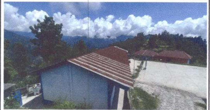
Foto 2: Mantenimiento a estructura de soporte de metal, un total de 347.50 m2.